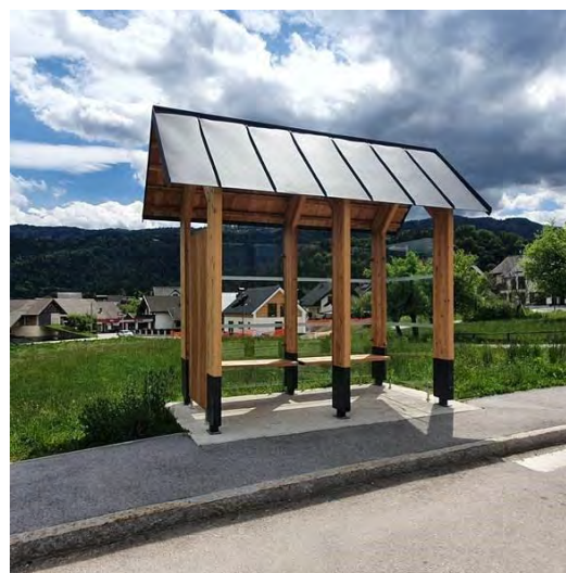
Primer urbanistično primernejše avtobusne postaje