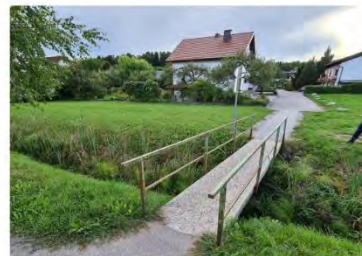
Ta že ima novo proti drsno betonsko ploščo, le v les bi ga oblekli in pritrtili