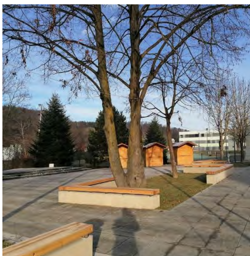
Sedišča klopi obložena z lesom