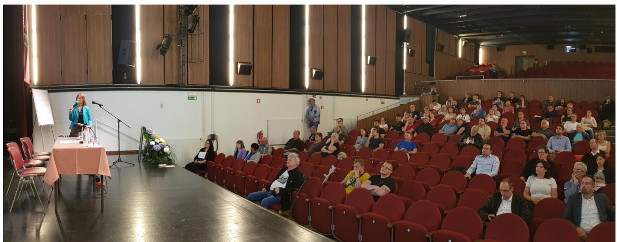
Slika 2 Utrinek iz javne predstavitve

Podrobnejša vsebinska predstavitev je sledila predstavitvi, ki je objavljena tudi na spletni strani Občine Vrhnika .