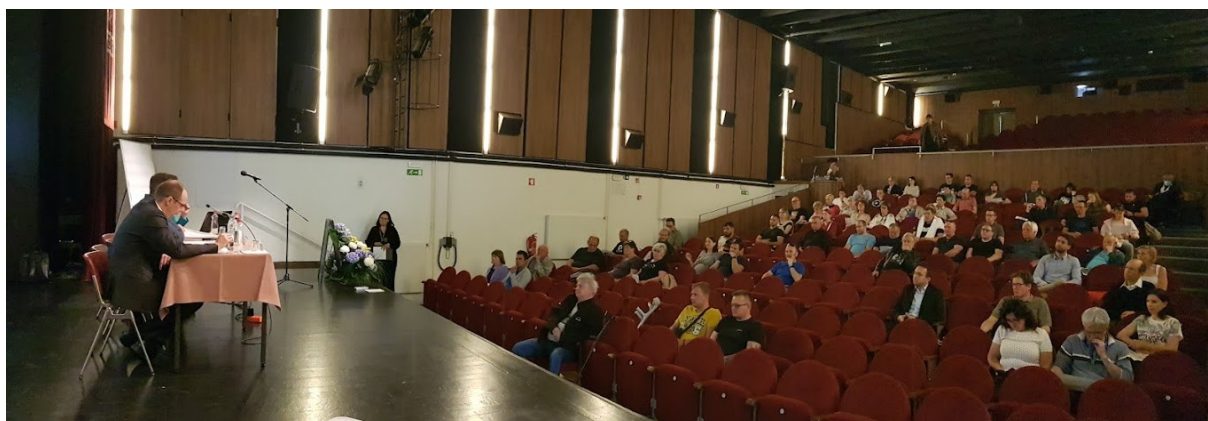
Slika 1 Utrinek iz javne predstavitve