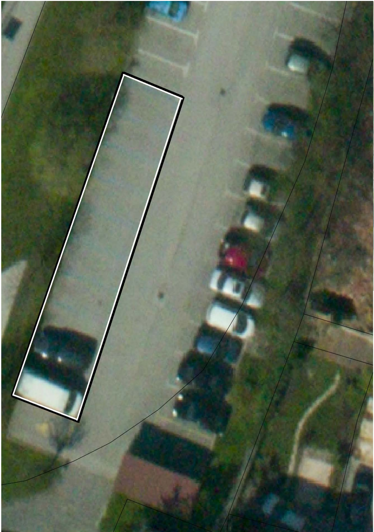
Priloga IV. Prikaz lokacije časovno omejenega parkiranja pri Črnem orlu, Cankarjev trg 4 na Vrhniki.