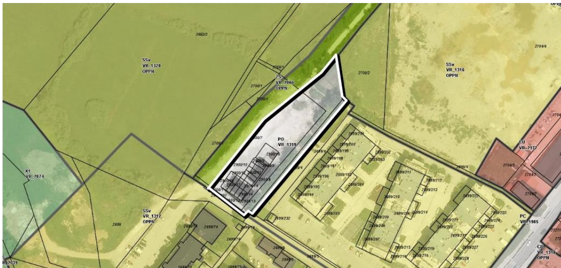
Slika: Enota urejanja prostora VR_1319

S tehničnim popravkom se na območju dovoljujejo tudi drugi posegi, ki so možni pred ureditvijo parkirišča oz. izgradnjo garaž oz. garažne hiše. Krajevna skupnost Vrhnika – Breg želi na delu območja urediti javno otroško igrišče.