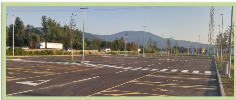
P+R parkirišče v Sinji Gorici

Na Vrhniki je parkirnih površin dovolj, največji problem predstavljajo vozila dnevnik migrantov, ki zasedajo parkirna mesta v starejših večstanovanjskih soseskah. V mestu so urejene modre cone, plačljivih parkirišč ni. Urejeno je parkirišče P+R v Sinji gorici, ki pa je premalo izkoriščeno. Največji izziv v prihodnje bo zagotoviti ustrezno obratovanje obstoječega parkirišča P+R ter v upravljanju in uvajanju nadzora (npr. uvajanje režimov, parkiranje na bankini ob cesti, parkiranje tovornih vozil ipd). Za parkiranje se uporabljajo tudi površine, ki bi sicer lahko gostile drugačno rabo.