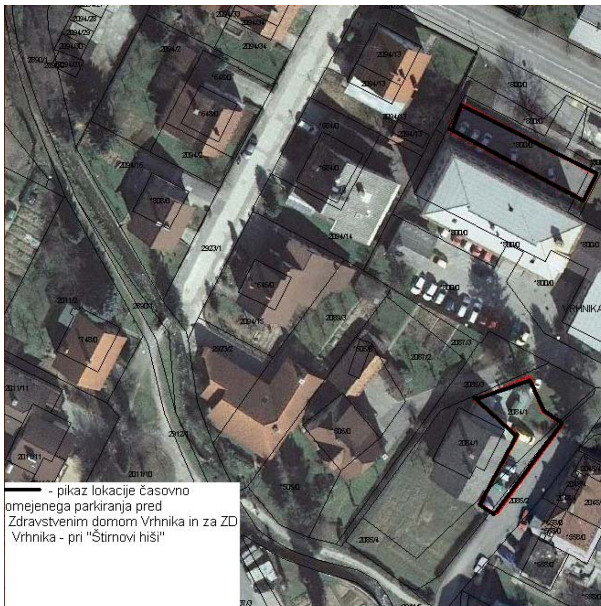
Priloga XII. Prikaz lokacije časovno omejenega parkiranja pred Zdravstvenim domom Vrhnika in za ZD Vrhnika pri "Štirnovi hiši".